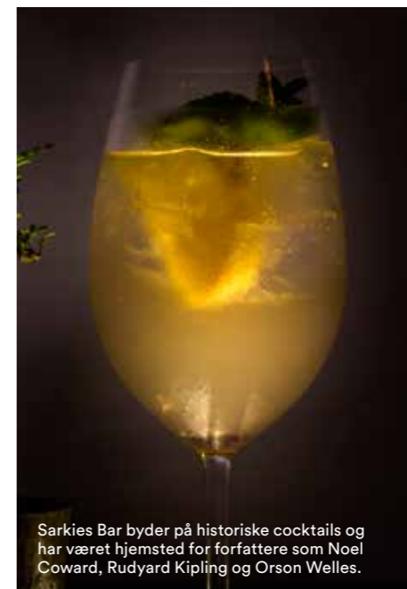
Sarkies Bar byder på historiske cocktails og har været hjemsted for forfattere som Noel Coward, Rudyard Kipling og Orson Welles.