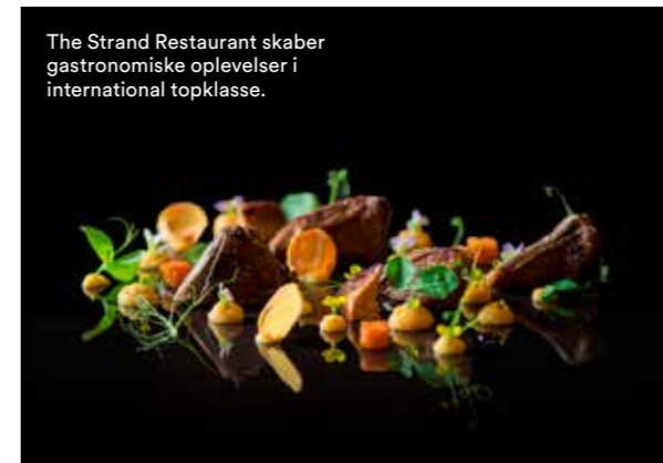
The Strand Restaurant skaber gastronomiske oplevelser i international topklasse.