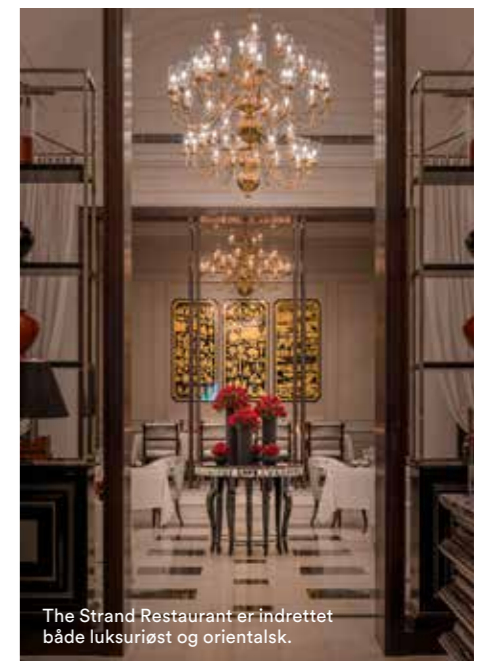
The Strand Restaurant er indrettet både luksuriøst og orientalsk.

”Historiens vingesus og storhed kan mærkes, når man træder ind i den store lobby, der åbner sig i midten med svalegange, et smukt palmeglasloft og antikke faner”