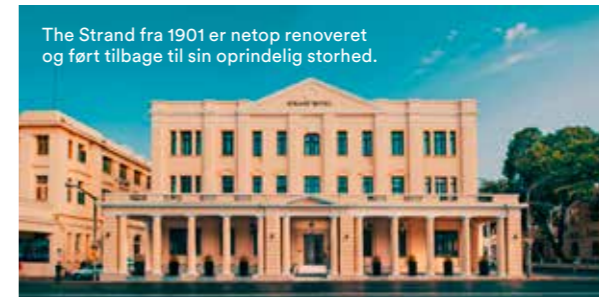
The Strand fra 1901 er netop renoveret og ført tilbage til sin oprindelige storhed.